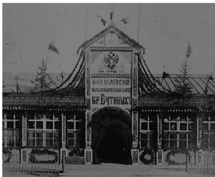
Николаевский железодельный завод в 1890 г.