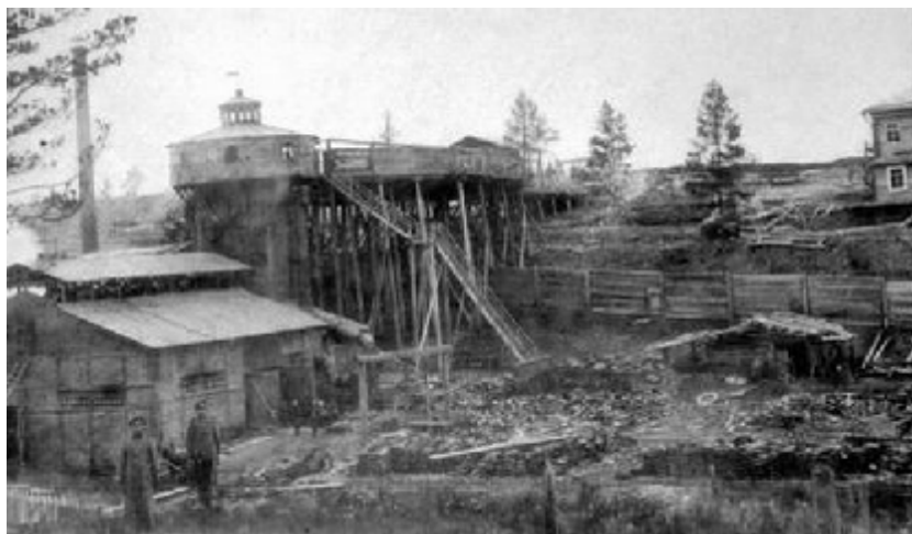
Николаевский железодельный завод в 1870 г.